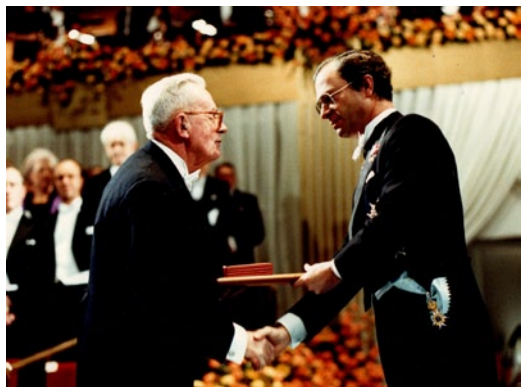
Maurice Allais recevant le Prix Nobel de Sciences Économiques en 1988

La Fondation ParisTech est l'une des rares fondations abritantes dédiées à l'enseignement supérieur et à la recherche, permettant ainsi d'accueillir sous égide des fondations dites « abritées » . Ce statut permet aux fondateurs de bénéficier d'une expertise et d'un cadre sécurisé pour y développer des projets de philanthropie personnalisés.